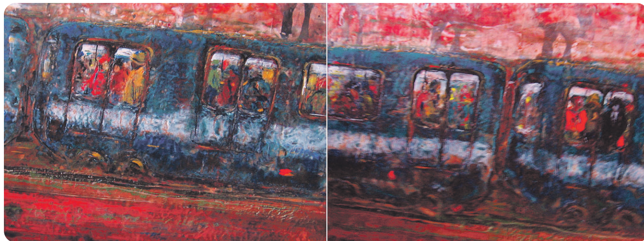
The Train Ride (diptyque), encaustique sur panneau.