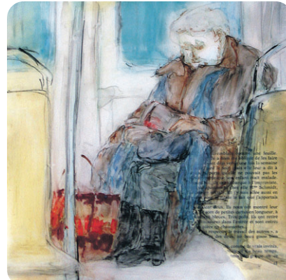
Le roman Harlequin, technique mixte sur mylar.

L'exposition Dans le métro se poursuit jusqu'au 9 avril au Centre communautaire Elgar (260, rue Elgar, île des Sœurs), du lundi au vendredi de 9 h 30 à 21 h et les samedis et dimanches de 12 h à 17 h. L'entrée est libre. Pour vous rendre à l'île des Sœurs en transport collectif, empruntez la ligne de bus 12 – Île-des-Sœurs à la station de métro LaSalle ou la ligne 168 – Cité-du-Havre aux stations McGill ou Square-Victoria. Pour plus d'information sur l'exposition, composez le 514 765-7270 ou visitez le blogue de l'artiste : http://rochellemayer.blogspot.com/